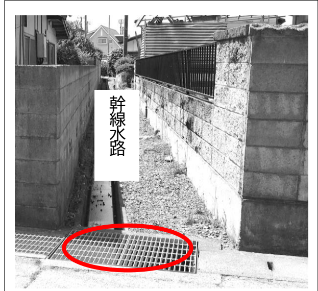
③令和4年度完成路線